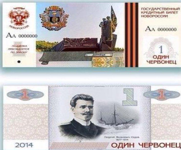
Рис. 2. Эскизы валюты «ДНР» и «ЛНР»